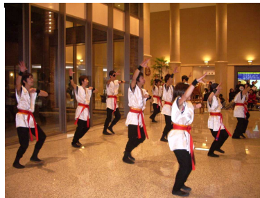
田川パラパラ炭坑節隊