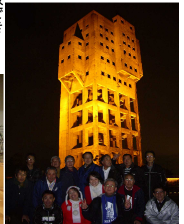
ライトアップスタッフの記念撮影