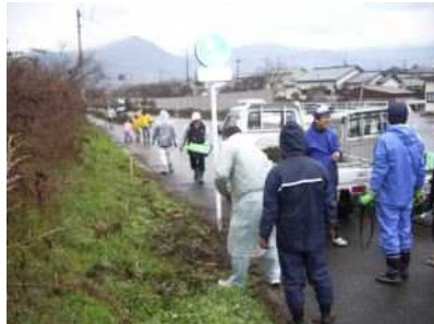
菜の花手入れの作業風景