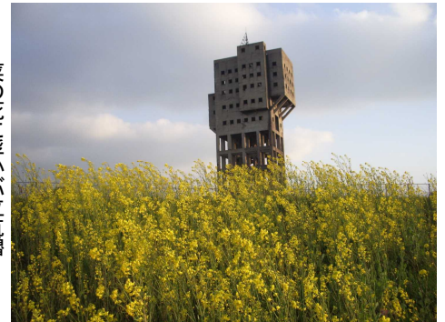
菜の花に浮かぶ立坑櫓