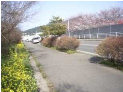
須恵町側の菜の花と桜の競演

雨の中頑張りました 菜の花の手入れ 3月18日せつかく 企画したボタ山登山は雨で中止となりましたが「菜の花」の手入れはできました。心配していた発育も他の立派な所とは比較できませんが、写真のように痩せた土地のボタでは上出来で、逆にPRポイントとして大いに自慢できることです。本当にお疲れ様でした。