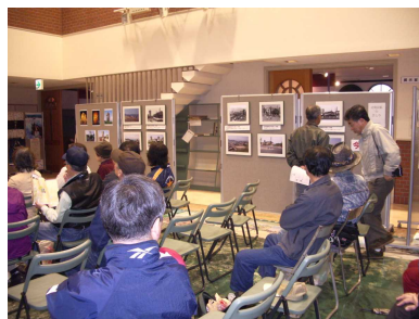
写真展示会場での櫓写真(荒尾)

4月2日、荒尾「万田坑市民まつり」が開催され、伝承ネットでは各地から写真を提供して写真展を開催しました。志免からも15点展示しました。近い時期、志免でも開催予定です。